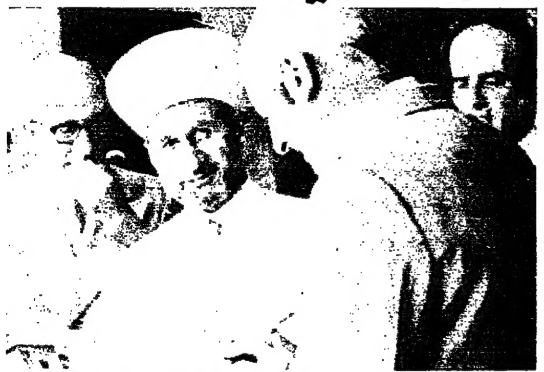
ساحة مفتي الجمهورية الشيخ خالد بجلي بصحبة في القصر الجمهوري